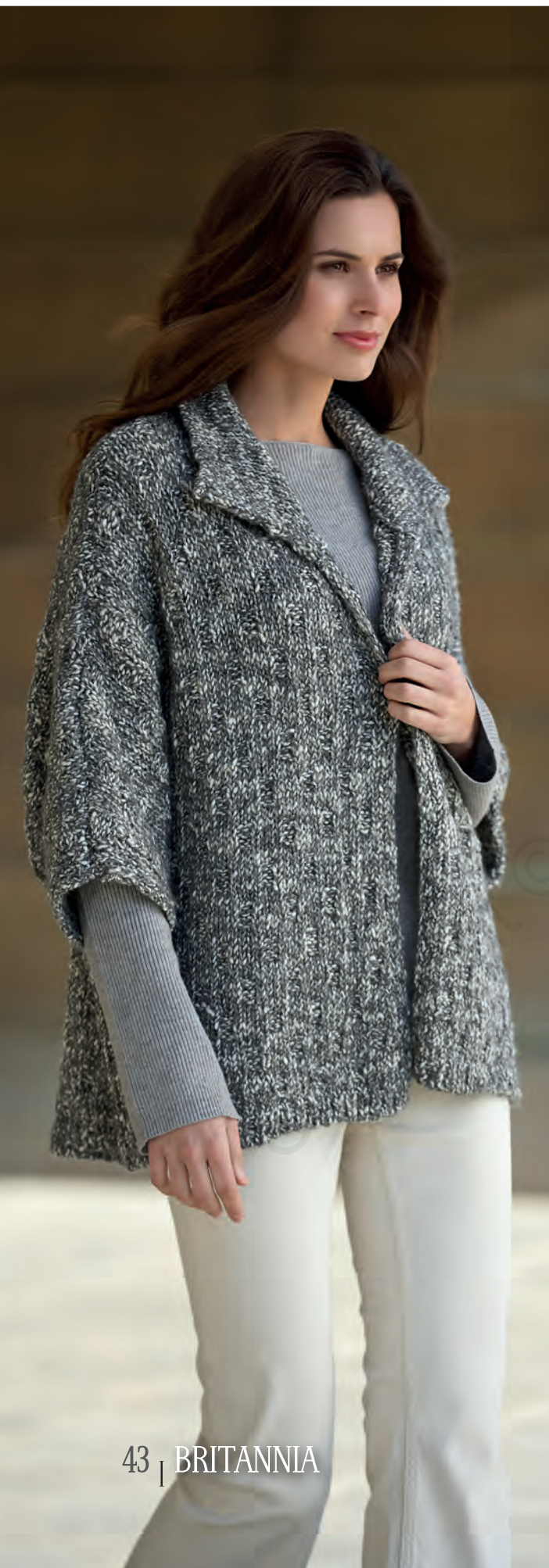
43 | BRITANNIA